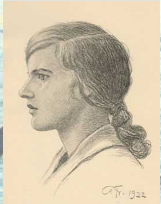
Ung pige fra Syd-Samsø.